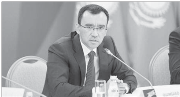
Парламент Сенатының төрағасы Мәулен Әшімбаев Елбасының «Абай аманаты» атты мақаласына орай пікір білдірді.

«Елбасының «Абай аманаты» атты мақаласын бір деммен оқып шықтым. Туынды Тұңғыш Президентіміздің Абайды алғаш таныған кезінен бастап, ұлы ойшылдың өсиет сөздерімен өрілген. Мақаланы оқу арқылы Елбасы өміріне, оның ішінде ел басқарудағы іс-әрекетіне ақынның ғибраттары қаншалықты әсер еткенін бұрынғыдан