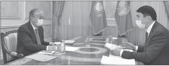
Мемлекет басшысы Экология, геология және табиғи ресурстар министрі Мағзұм Мырзағалиевті қабылдады.

Қасым-Жомарт Тоқаевқа Экология, геология және табиғи ресурстар министрлігінің биылғы 9 айда атқарған жұмыстарының негізгі бағыттары жөнінде есеп берілді. Мағзұм Мырзағалиев Президентке қаралып жатқаны туралы егжей-тегжейлі баяндалды. Мемлекет басшысы аталған құжатқа он баға беріп, еліміздегі экологиялық жағдайды жақсартуға бағытталған жаныялықтарды атап өтті. Қасым-Жомарт Тоқаевтың