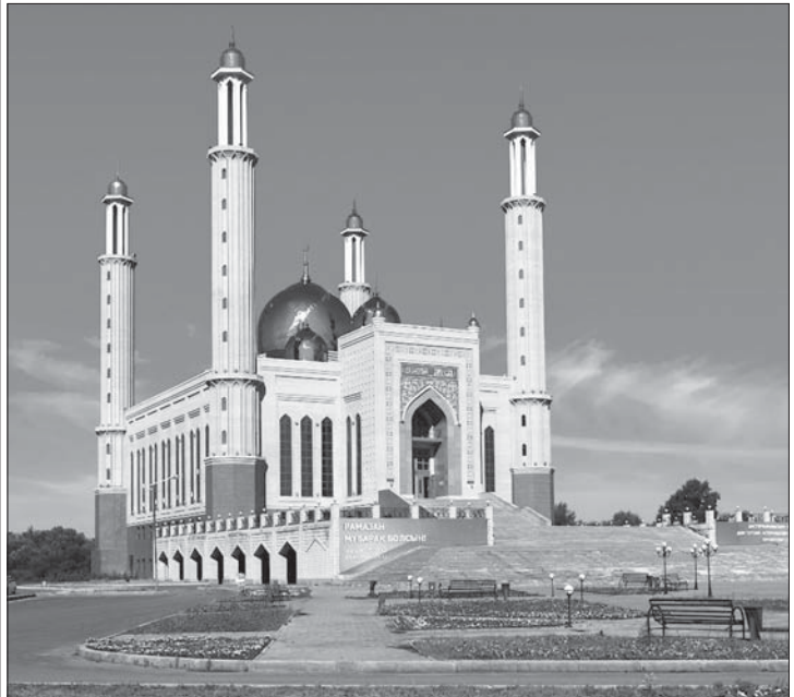
ХАЛИФА АЛТАЙ МЕШИТІ ▶

Шығыс Қазақстан облысындағы ең ірі, республикамыздағы ең үлкен үш мешіттің бірі. Үш мың адамға арналған. Мешіт өңір тұрғындары, мемлекеттік және коммерциялық кәсіпорындардың қайырымдылығы көмегімен және Араб Әмірінің демеушілік қолдауымен салынды. Мешіт құрылысына 20 мыңға жуық адам атсалысқан.