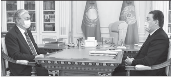
Президент Қасым-Жомарт Тоқаев Премьер-министр Асқар Маминді қабылдады.

Мемлекет басшысына 2020 жылдың қорытындысы бойынша ел дамуының макроэкономикалық көрсеткішінің болжамды есебі мен республикадағы санитарлық-эпидемиологиялық ахуал жайында баяндалды.