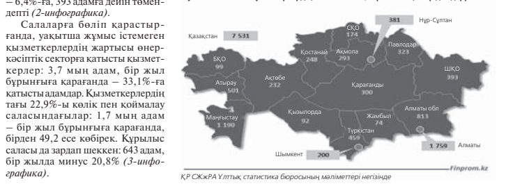
ҚР СЖЖРА Улттық статистика бюросының мәліметтері негізінде