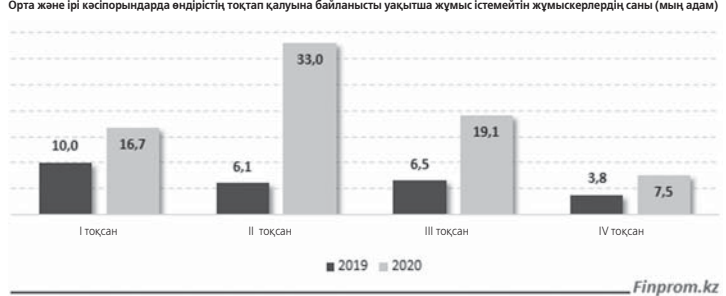
ҚР СЖЖРА Улттық статистика бюросының мәліметтері негізінде