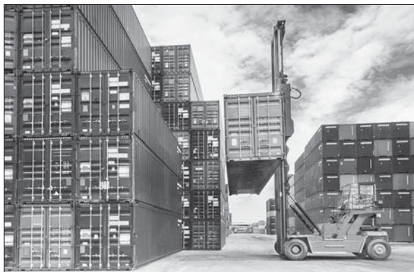
Пандемия салдарына қарамастан өткен жылдың қорытындысында Қазақстан мен Түркия арасындағы сыртқы сауда айналымы 3 млрд доллардан асты.

Қазақстан мен Түркия арасындағы дипломатиялық қатынастарға 29 жыл толды. 1992 жылы екі елдің арасындағы сыртқы сауда айналым небәрі 30 млн доллар болған. Бауырлас елдер алдағы уақытта бұл көрсеткішті одан әрі арттырып, бастапқыда 5 млрд доллар, кейін 10 млрд долларға жеткізуді ортақ мақсат тұтып отыр. Түркия 1992 жылдан бастап Қазақстанға 4,3 миллиард доллар инвестиция құйса, Қазақстан Түркия