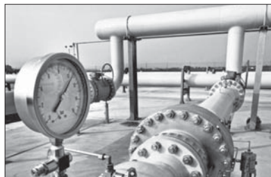
Газдың ең төменгі орташа құны Ақтөбе облысында. Мұнда көгілдір отынның 1 текше метрі 12 теңге тұрады. Бұл жалпы елдегі бағадан (м3 үшін 23 теңге) екі есе төмен.

Түркістан облысы мен Шымкент қаласында жанар-